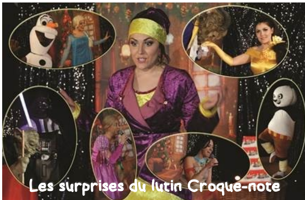
Les surprises du lutin Croque-note

NOUVEAU Marché de Noël de 14h à 22h dans la cour de l'école élémentaire !