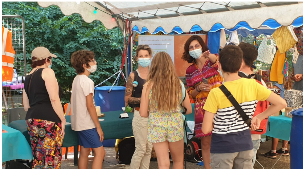
Une vue des stands

En soirée, après un repas de qualité, préparé par des producteurs locaux, une table ronde concernant notre futur a précédé la projection du film « 2040 », en plein air. Une réussite puisque près de 300 visiteurs, ont été enregistrés !